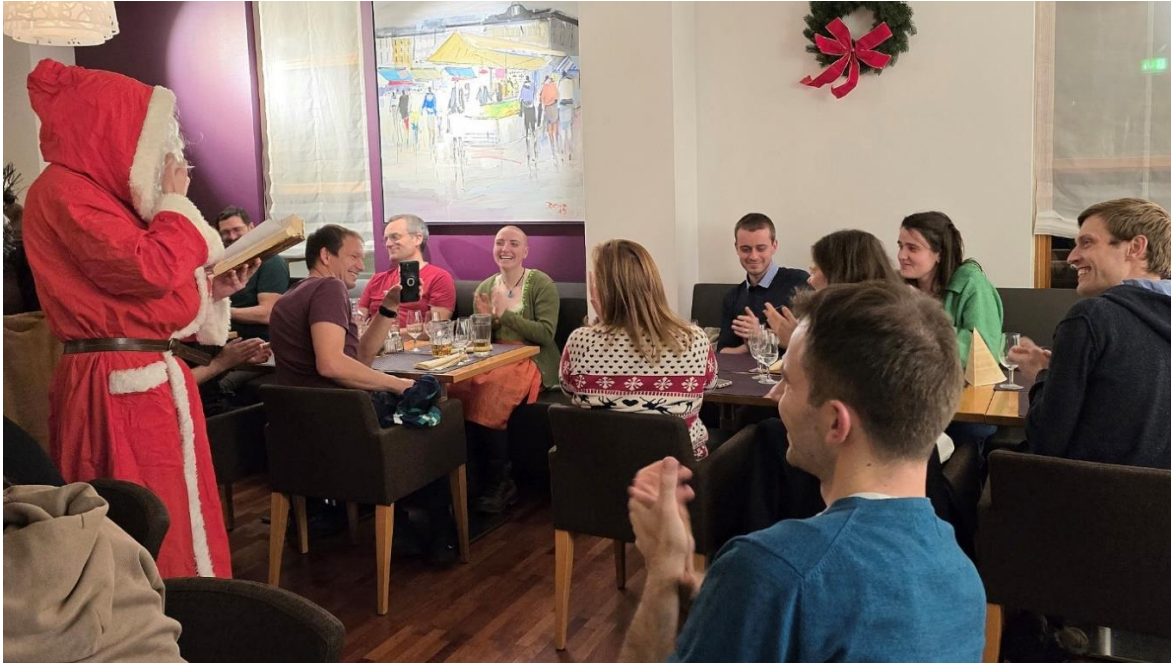
Mit allerlei Pointen aus dem «Mitglieder-Sündenregister» wusste der Chlaus die Gemüter zu erheitern und so manchem ein Schmunzeln zu entlocken.