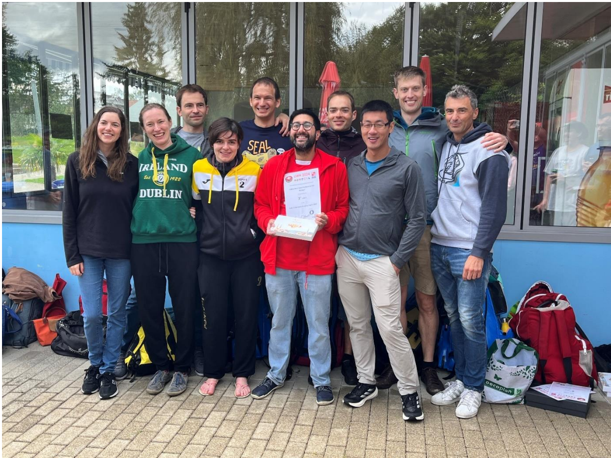
Swiss UWH Trophy

Gerne möchte ich mich bei einigen Wahoos besonders bedanken: